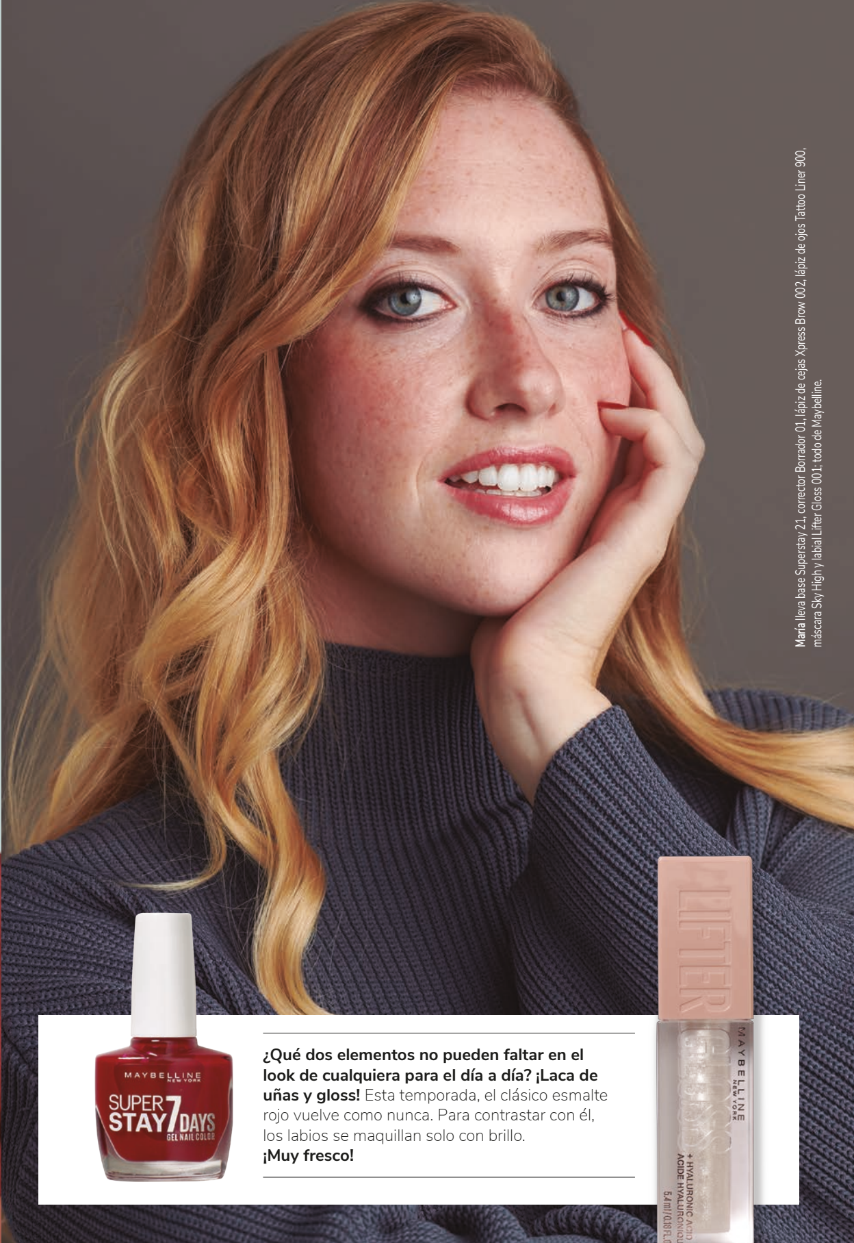
María lleva base Superstay 21, corrector Borrador 01, lápiz de cejas Xpress Brow 002, lápiz de ojos Tattoo Liner 900, máscara Sky High y labial Lifter Gloss 001; todo de Maybelline.