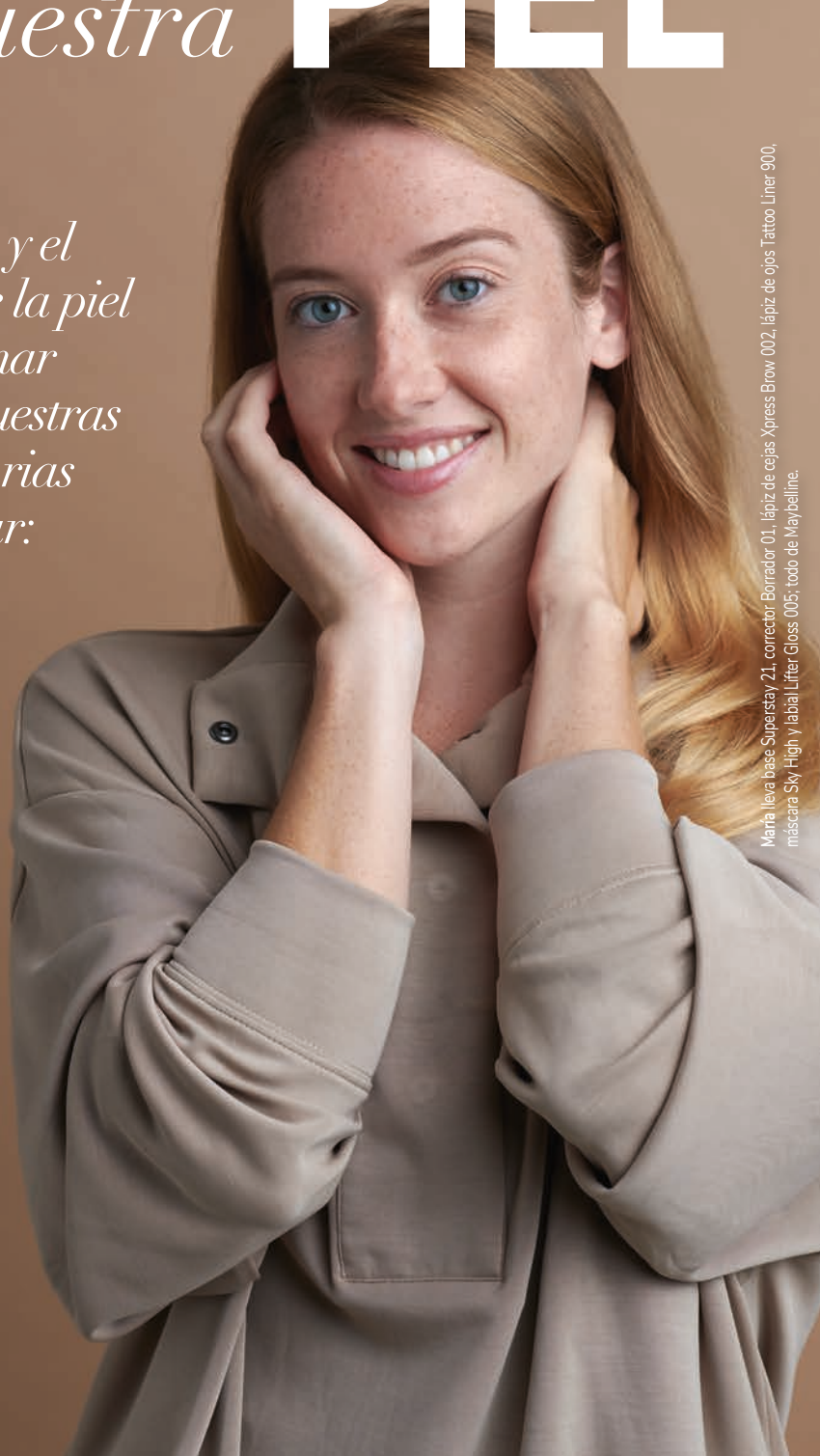
Manita lleva base Superstay 21, corrector Borrador 01, lápiz de cejas Xpress Brow 002, lápiz de ojos Tattoo Liner 900, máscara Sky High y labial Lifter Gloss 005; todo de Maybelline.

contamos con una amplísima gama de productos que nos ayudarán a llevarlas a cabo correctamente.